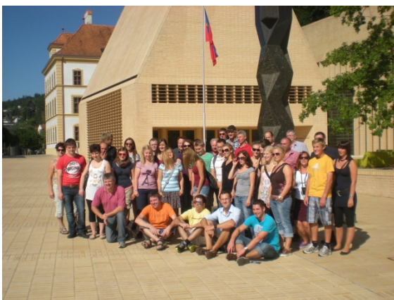
Vor dem modernen Landtagsgebäude in Liechtenstein

Zahlreiche weitere Fotos gibt es im Internet unter samarein.com zu sehen!