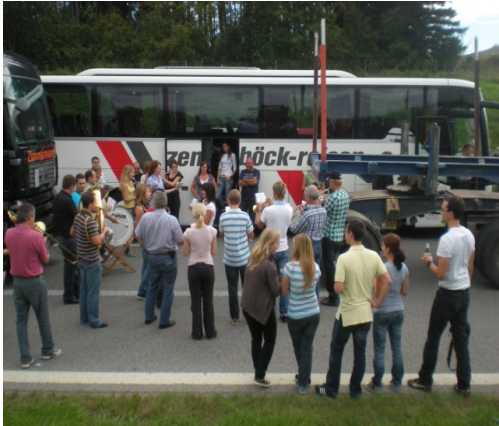
Auf der Autobahn

Eine Schar illustrierter Stauleidensgenossen aus aller Herren Länder war begeistert ob dieser Aktion.