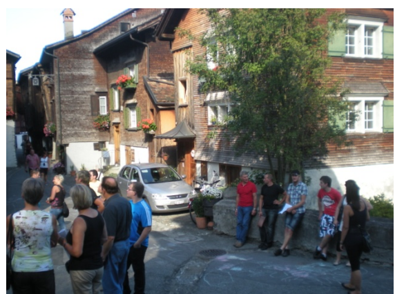
In Werdenberg, der kleinsten Stadt der Schweiz